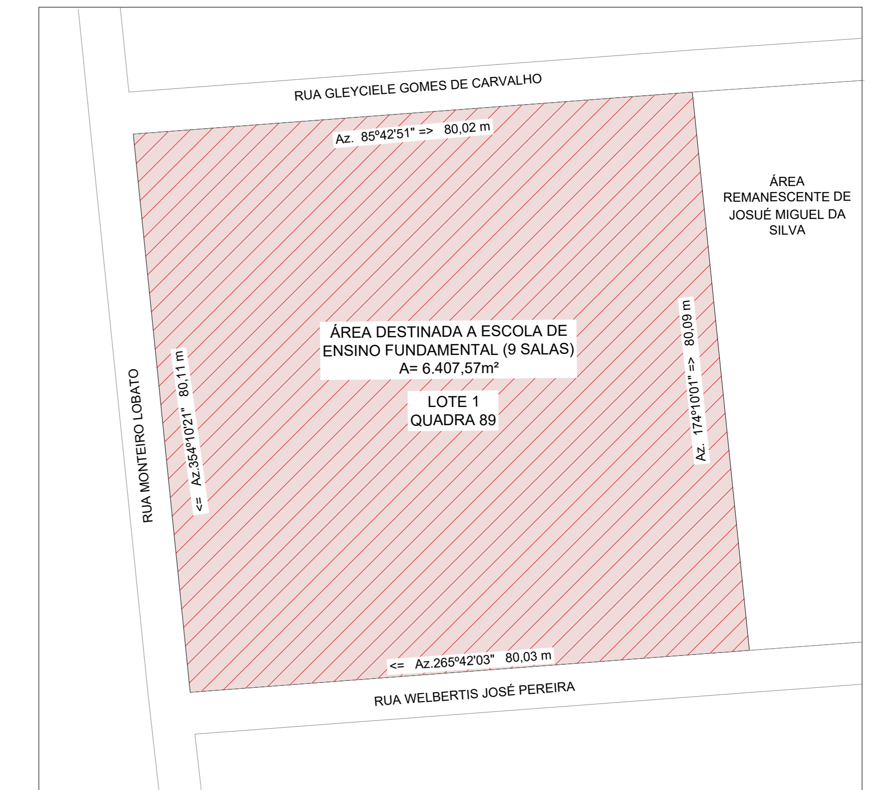
1 Planta de Situação Escala: 1 : 750